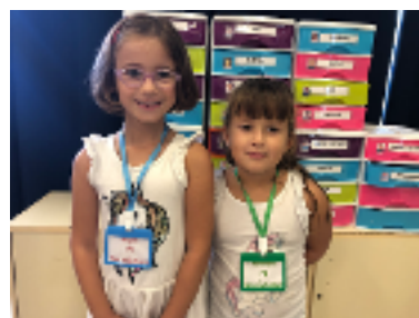
Delegada y subdelegada de 1ºB.